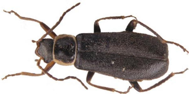
Obr. 1. Samice Cantharis fibulata z NPR Povydří.

Dosud známý výskyt v České republice byl omezen na oblast Krkonoš (ŠVIHLA 2006). Poprvé doložen z území západních Čech. Jedná se o první konkrétně uvedené údaje z území České republiky.