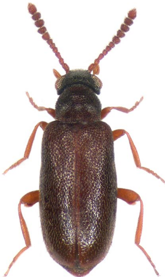
Obr. 1. Vanonus brevicornis brevicornis z lokality Novákovice.

JALOSZYŃSKI P., WANAT M., KUBISZ D., RUTA R. & KONWERSKI S. 2013: A synopsis of the family Aderidae in Poland (Coleoptera: Tenebrionoidea). – Genus, 24 (2): 199–216. — KLIMA A. 1902: Catalogus insectorum faunae bohemicae VI. Die Käfer (Coleoptera). – Verlag der Gesellschaft