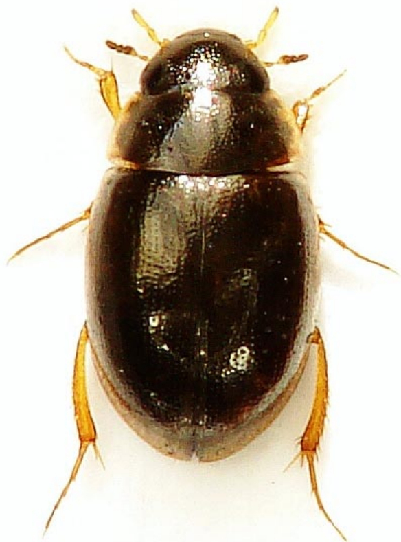
Obr. 1. Vodomil Laccobius atratus z lokality Štítary. Fig. 1. Laccobius atratus from the locality of Štítary.

no 9 druhů (BOUKAL et al. 2007). Druh L. atratus má černou šagrévanou hlavu bez žlutých skvrn před očima, štít hladký bez chagrínování a řádky teček na krovkách velmi nepravidelné. Jednoznačná identifikace je však v tomto determinačně poměrně obtížném rodu možná teprve po studiu samčích genitálií (Obr. 2), protože habituelně jsou jednotlivé druhy