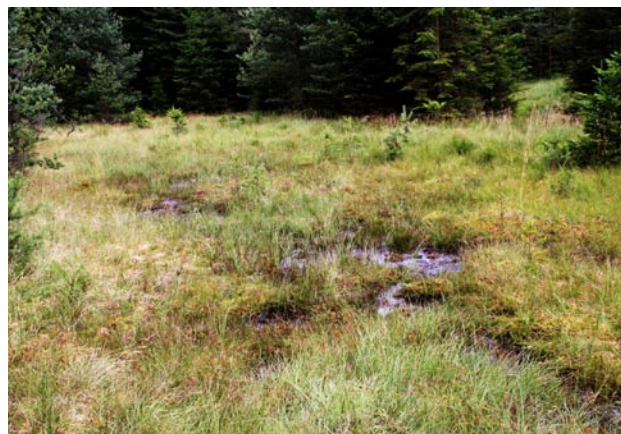
Obr. 4. Lokalita Laccobius atratus u Štítar.

menné oblasti Lužního potoka (Obr. 4). Lokalitu tvoří komplex otevřeného lučního prameniště a přechodového rašeliniště. Ve vegetaci na lokalitě dominují rašeliníky prorostlé různými druhy ostríc, sítin a suchopýřů. Přítomné jsou zde i rosnatka okrouhlolistá ( Drosera rotundifolia ) a klikva bahenní ( Oxyccocus palustris ). Všechny exempláře L. atratus byly nalezeny při lovu vodní sítkou po předchozím prošlapání rašeliníků a odumřelých vrstev travin. Tyrfofilní charakter společenstva brouků dokresluje doprovodné druhy nalezené stejnou metodou: potápníci Hydroporus kraatzi Schaum, 1868, H. longicornis Sharp,